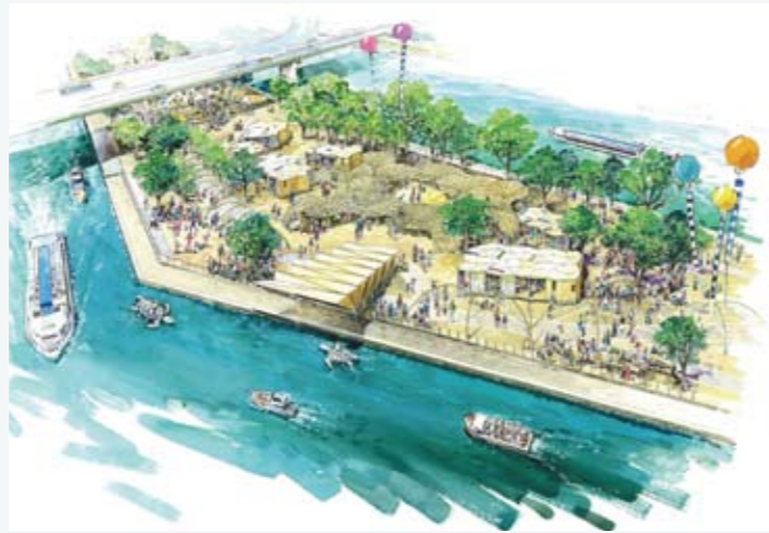
水辺の文化座 (イメージ)