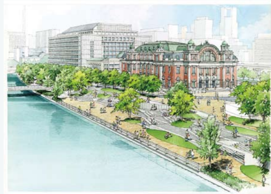
中之島公園再整備 (イメージ)