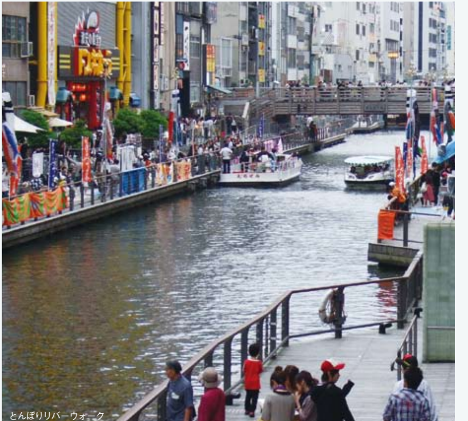
とんぼりリバーウオーク