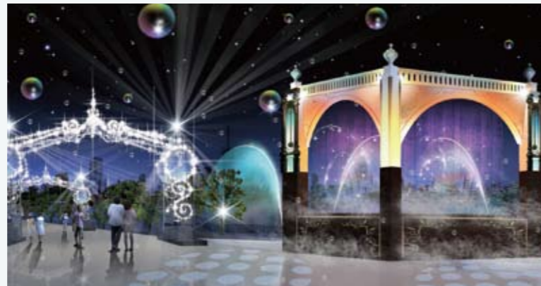
ナイトプログラム (イメージ)