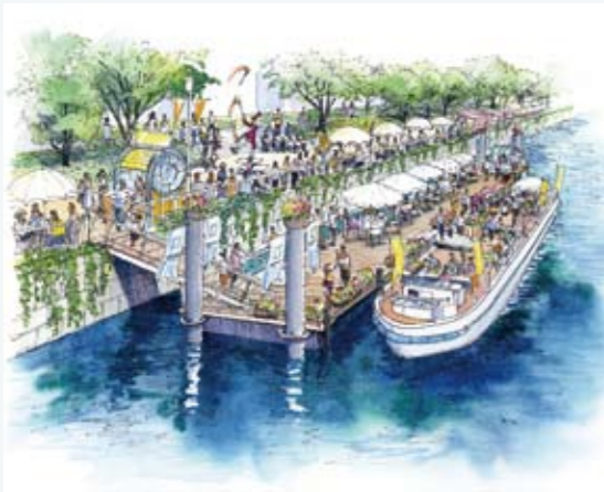
水都朝市リバーカフェプログラム (イメージ)