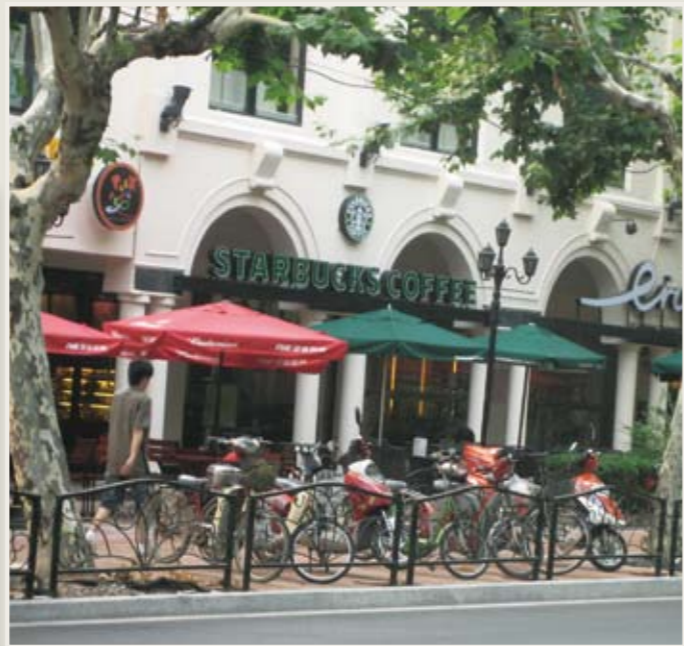
昔の洋館を利用したカフェ