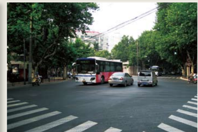
昼間は閑静な住宅街