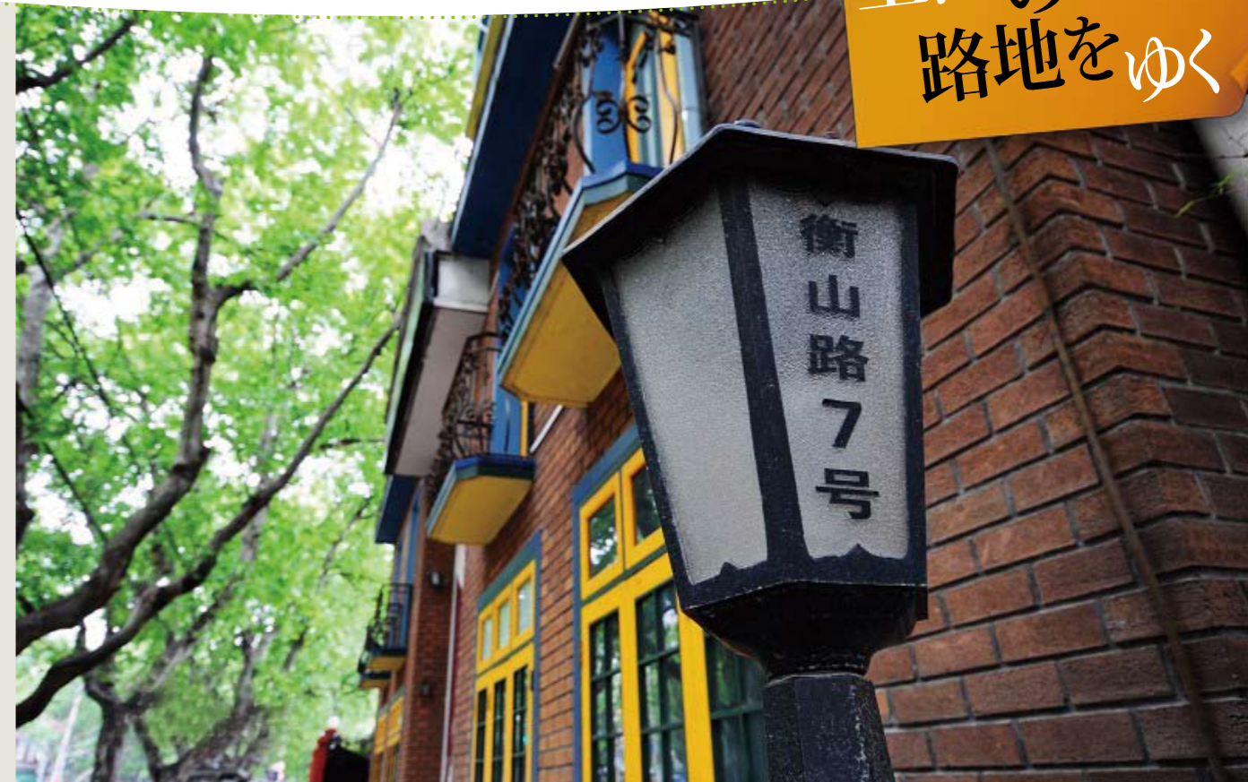
歴史を感じさせる数多くの洋館