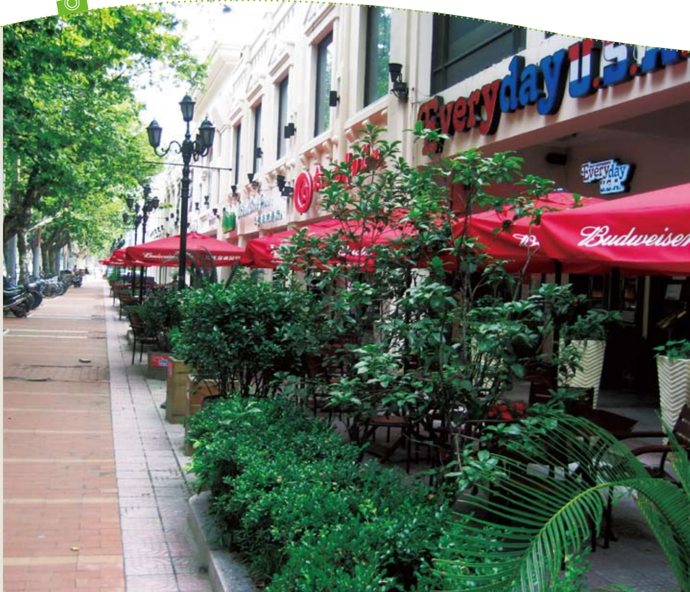
レストラン、バーが軒を並べる