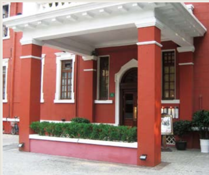
古い邸宅。今はレストラン&バー