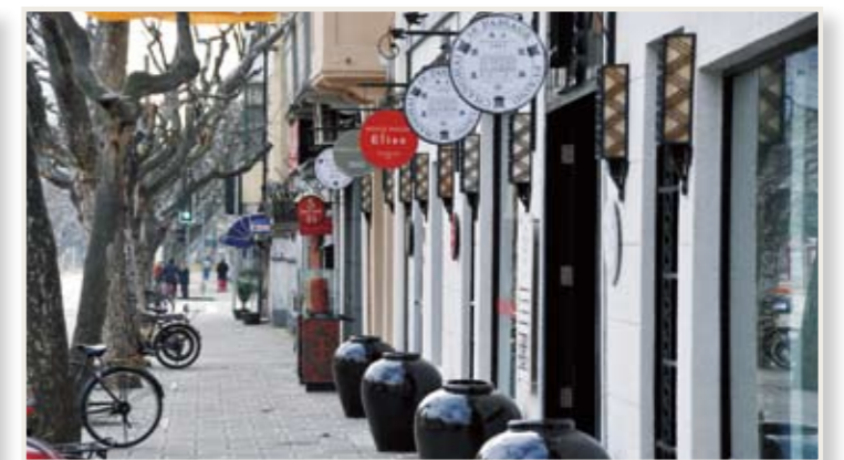
洋館を改造したレストランやバーやショップなどが多い