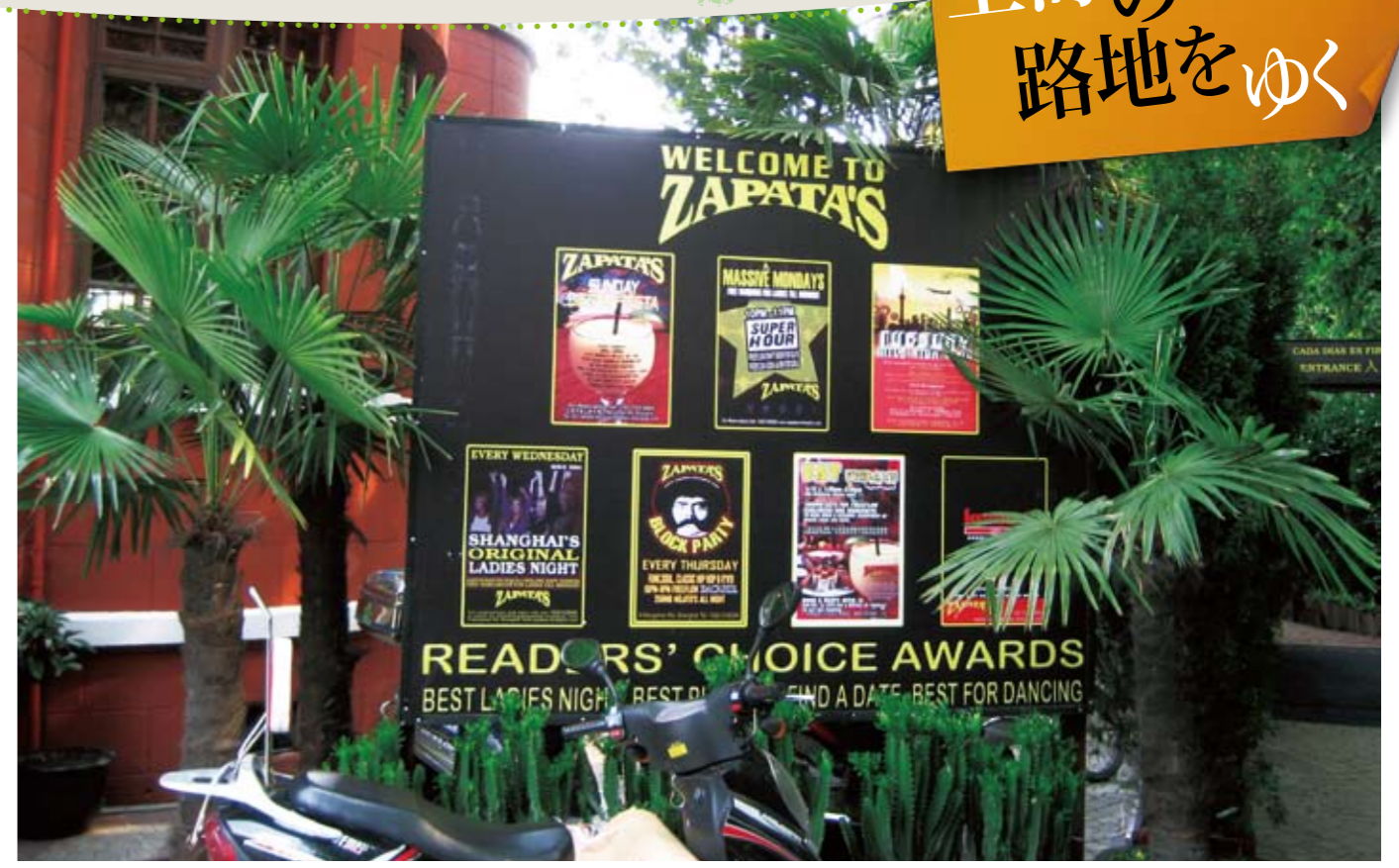
古い邸宅の中庭はバー