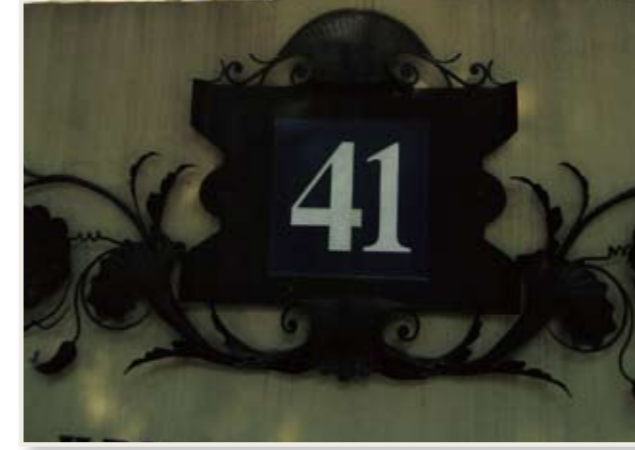
外国人がステイタスとしている41公寓(マンション)

● ACCESS 地下鉄 1号線衡山路下車 路線バス 15番、49番、93番、830番