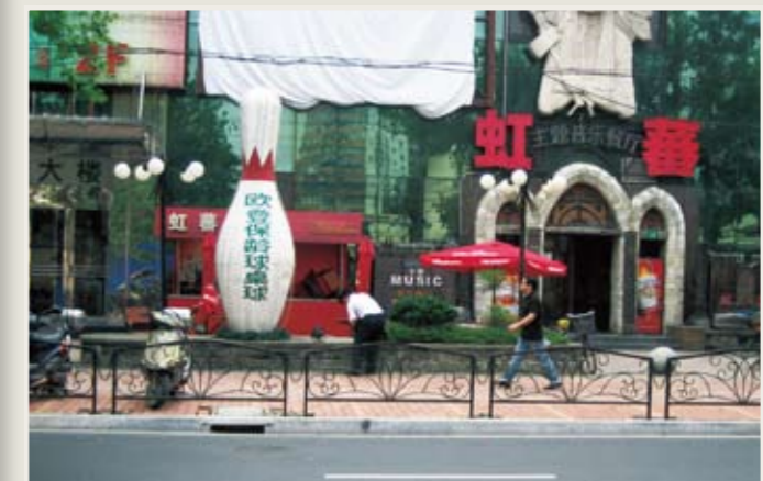
上海では数少ないボーリング場の一つ