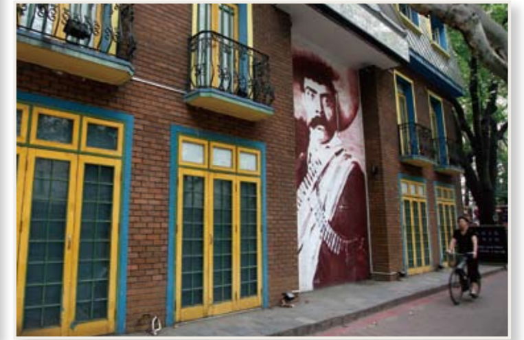
人気あるバーの一つ