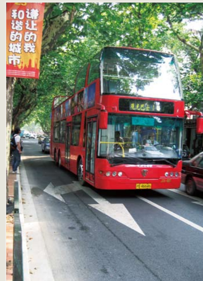
二階立て市内観光バス