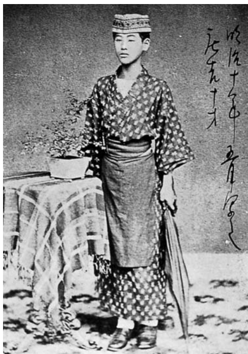
10歳の頃の梅屋庄吉 幼少時から正義感が強く、好奇心旺盛な庄吉には数々のエピソードがある。小学校を卒業すると大阪屋京都を放浪し、また、地元の暴れ者に決闘を挑んだりと数々の武勇伝を残した