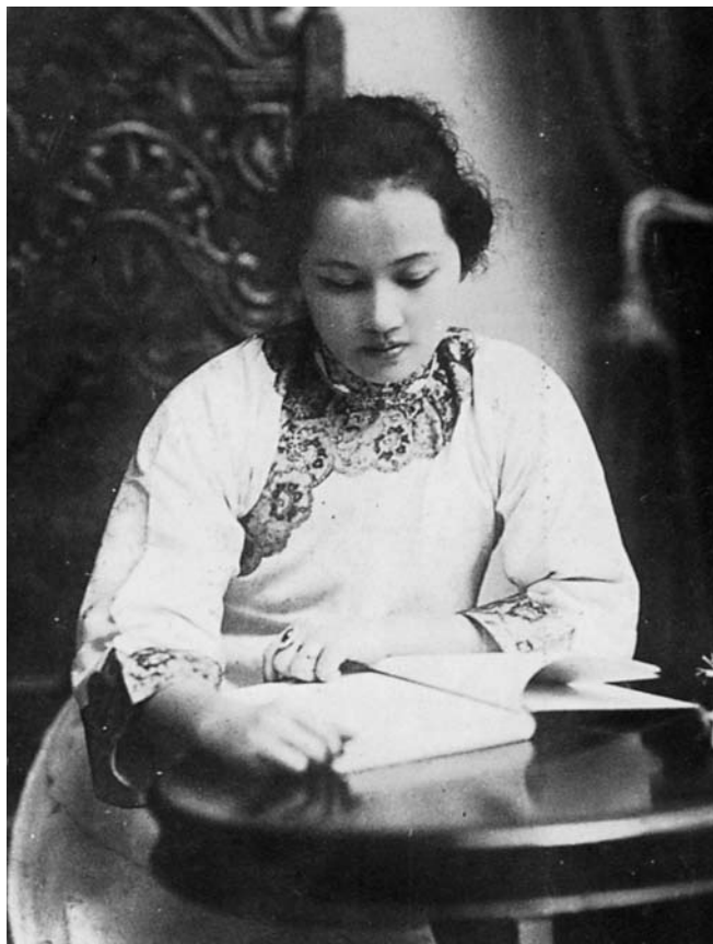
孫文の妻・宋慶齡 宋慶齡（1893唐1981）は中国の実業家の次女として生まれた。アメリカに留学後、1914年に東京に亡命中の孫文の秘書となった。翌年に二人は結婚。この時期、梅屋庄吉夫妻から公私にわたって世話を受ける。革命運動を再開させるために孫文とともに帰国。孫文の死後も孫文思想の啓蒙に努めた