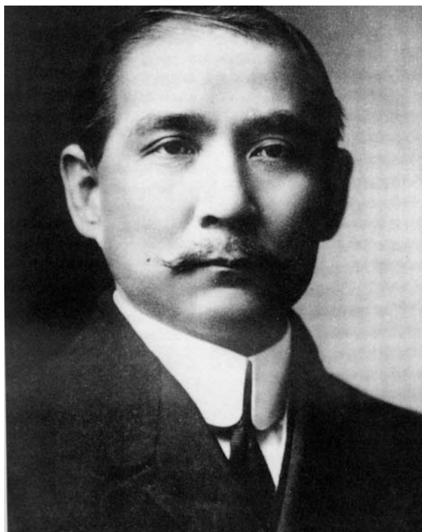
若き日の孫文 医師を目指して勉学に励む一方で、友人と革命を論じた。医師をしながら革命団体の組織作りに奔走。写真は1895年ハワイで革命団体「興中会」を組織した後、帰国したときのもの