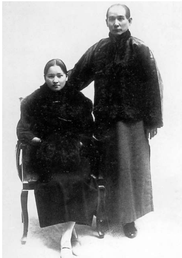
孫文・宋慶齡最後の写真 孫文死去の1か月前に撮影されたもの。病床にあって民族平等のための団結を訴え続けた